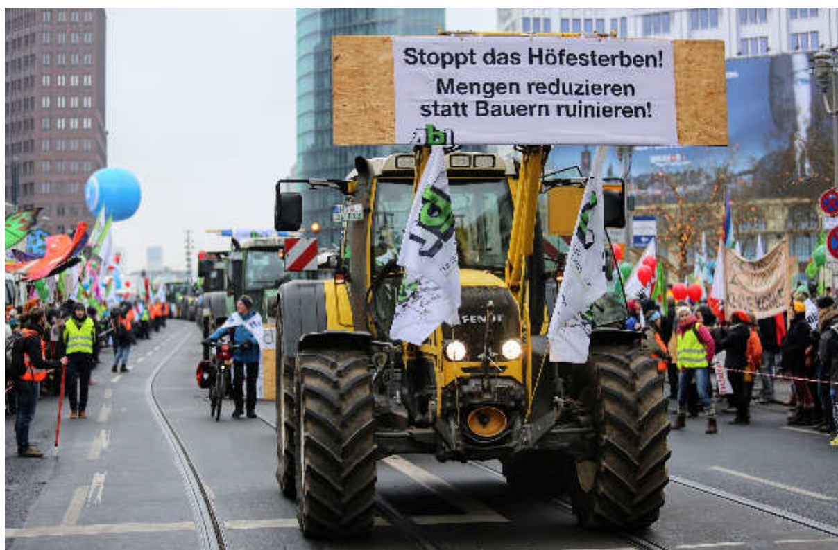
Die AbL hält die Exportorientierung auf dem Agrarmarkt für eine Sackgasse und setzt deswegen auf Qualität statt Quantität.

Die Milchmarktkrise 2015/2016 mahnt dringend dazu, auf EU-Ebene wirksame Instrumente zur Vermeidung solcher substanzvernichtenden Krisen bereit zu halten. Ausgelöst wurde der starke und lang anhaltende Preisrutsch durch eine über die Nachfrage hinaus gewachsene Milcherzeugung besonders in der EU als weltweit größtem Exporteur von Molkereiprodukten. Trotz stark fallender Erzeugerpreise steigerten viele Milcherzeuger die Menge noch, um sich auf diese Weise vorübergehend liquide zu halten. Das hat die Krise am Markt noch verstärkt. Allein in Deutschland haben zwischen Mai 2015 bis Mai 2017 insgesamt fast 7.500 Milchviehbetriebe aufgegeben, ein Rückgang von 10 % in zwei Jahren – ein Strukturbruch.